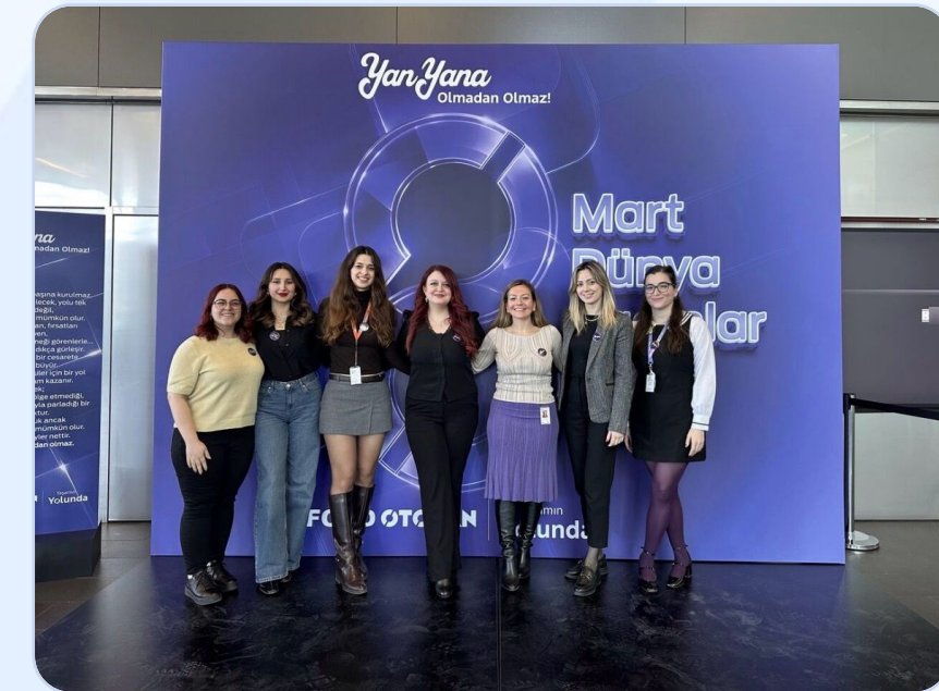
DEI Ekip ❤️